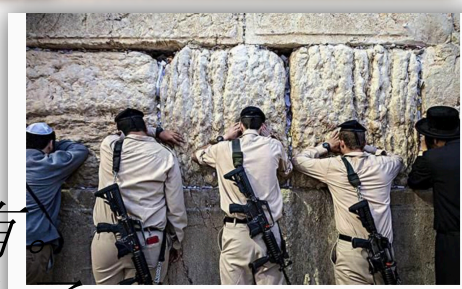
耶路撒冷的哭墙是当年圣殿的遗址

犹太人在波斯帝国的统治下过了一段相当幸福的岁月，但是后来又相继沦为希腊人和罗马人的属民，罗马人在巴勒斯坦地区建立了犹太省，对犹太人进行奴役和剥削，犹太人在公元一世纪左右，爆发了多次反抗罗马人的起义，但是后来都在罗马军队的铁骑所平息。到了公元70年左右，由于罗马人对犹太人的高压政策和宗教压迫，一场规模最大的犹太人起义爆发了，犹太起义军占领了耶路撒冷和加沙等城市，后来罗马皇帝派八万罗马大军去镇压，先后屠杀了近百万犹太人，并摧毁了位于耶路撒冷的犹太圣殿，幸存的犹太人被驱流落到世界各地，是犹太民族苦难的开始。